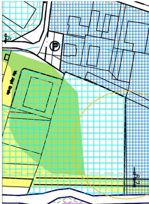
Fig. 4 - Estratto del P.R.G. elaborato D3 - "in variante" Tav. 4 – azzonamento 1/2000 - stralcio planimetria (confine fra la Zona In6 verso la Ic2)